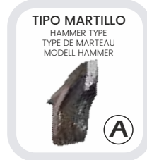
TIPO MARTILLO HAMMER TYPE TYPE DE MARTEAU MODELL HAMMER