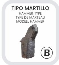
TIPO MARTILLO HAMMER TYPE TYPE DE MARTEAU MODELL HAMMER